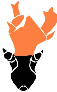
MASQUE DE PRONGHORN